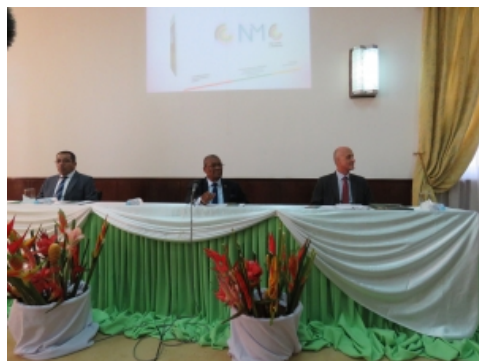
Cerimónia de abertura

24/05/2018 24 de Maio 2018, São Tomé e Príncipe - No âmbito da assistência prestada pela União Europeia a São Tomé e Príncipe, foi aprovado, em junho de 2014, o financiamento do Projecto AMCC – Redução da Vulnerabilidade Climática em São Tomé e Príncipe, com vista a apoiar a República Democrática de São Tomé e Príncipe (RDSTP) num processo eficaz e sustentável de adaptação à instabilidade e às alterações climáticas. Nestes termos, o Comité Nacional para as Mudanças Climáticas (CNMC) organizou, no passado dia 22 de Maio, no Palácio dos Congressos, o seminário “Adaptação Local às Mudanças Climáticas na RDSTP.” O evento foi presidido pelo Presidente da República Democrática de São Tomé e Príncipe, Evaristo de Carvalho.